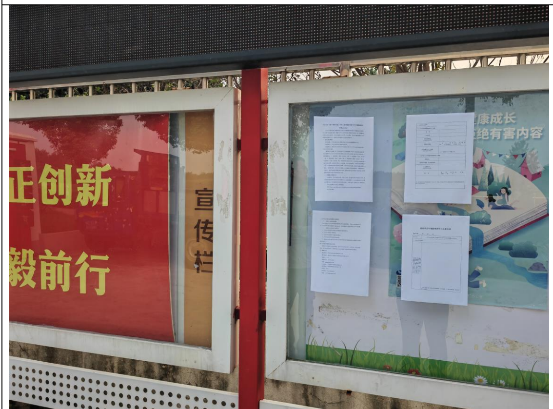
图 3-5 玉带社区村委会公示张贴照片