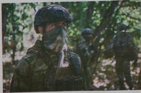
9月7日,卢甘斯克地区,在俄罗斯特种军事行动区,一名军匠正在接受训练

就如何加快结束俄乌冲突进行讨论。他和乌克兰总统弗拉基米尔·泽连斯基均认为,今后举行“乌克兰和平峰会”时,必须有俄罗斯参加。 泽连斯基没有回应朔尔茨这一说法。他当天在电视讲话中说,他与德