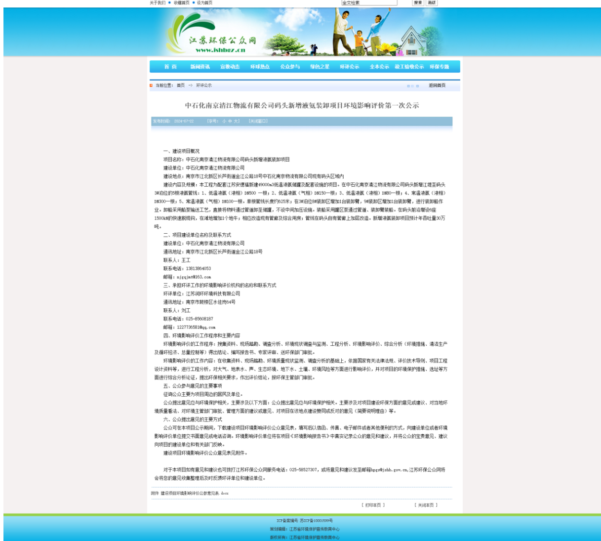
图 2-1 第一次环境影响评价信息网络公示截图

网络选取的符合性分析：“江苏环保公众网”是由江苏省环保宣教中心全力打造的面向公众的环保网站，符合《环境影响评价公众参与办法》对网络平台的要求。