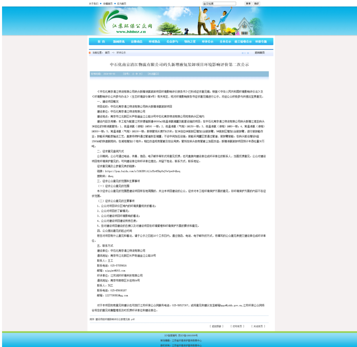
图 3-1 征求意见稿网络公示截图