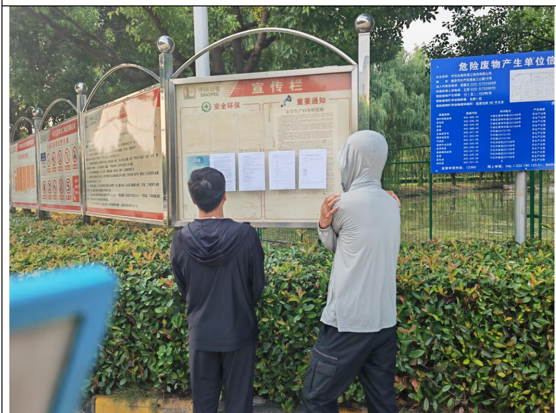
图 3-4 中石化厂区门口公示张贴照片