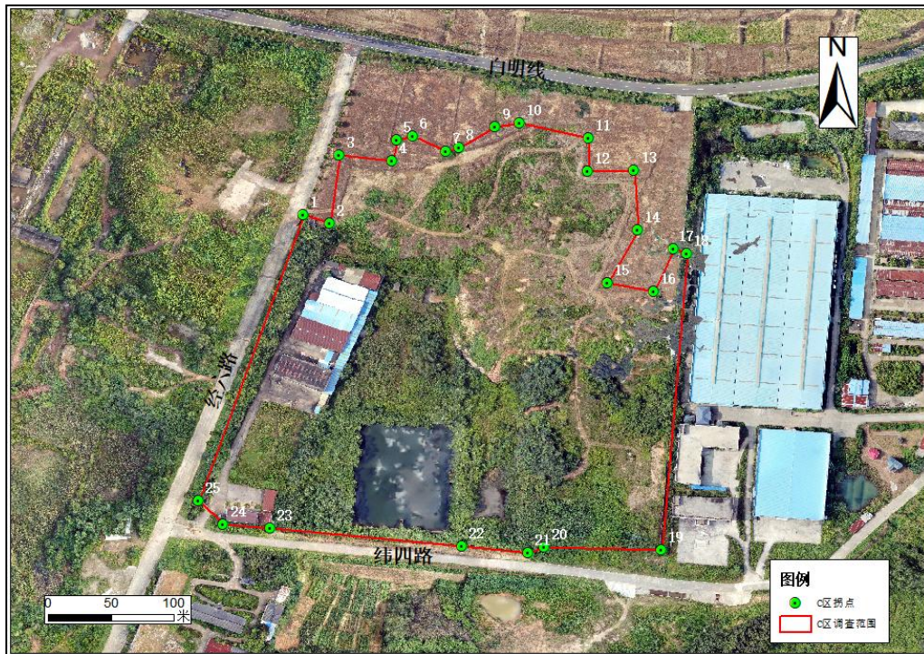
图 2 调查范围示意图（底图为 2021 年 7 月航拍）